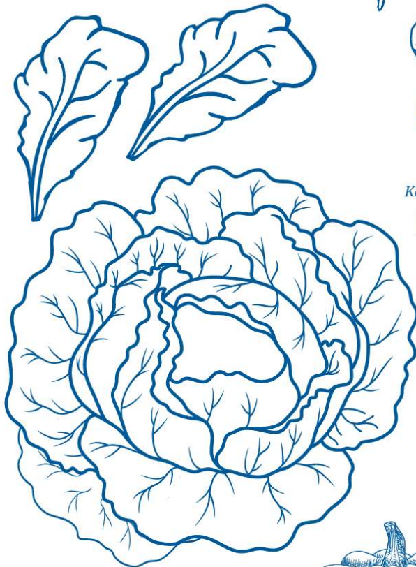
Kopfsalat mit einzelnen Blättern