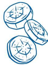
Karottenstücke & Karotten mit Karottengrün