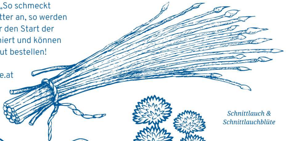
Schnittlauch & Schnittlauchblüte